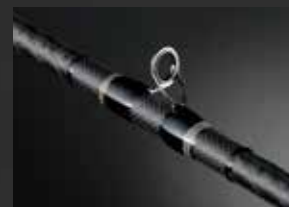
Fuji TORZITE GUIDE RING + TITANIUM FRAME ARMS SETTING