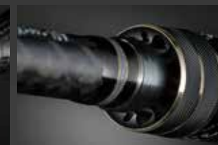
IHLs (ARMS Super Leggera ver.)